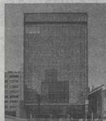
⑨ 銀洋新横浜駅前事務所