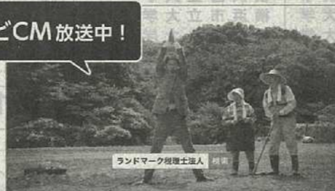
ランドマーク税理士法人