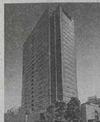
⑩ 武蔵小杉駅前事務所