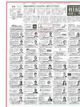
【日本経済新聞】 9月22日(金)16面 「信頼できる相続・贈与に詳しい相続税理士50選」にランドマーク税理士法人が掲載されています。