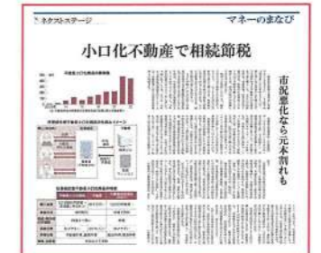
【日本経済新聞】 9月30日(土)24面 「小口化不動産で相続節税」に弊社代表 清田のコメントが掲載されています。