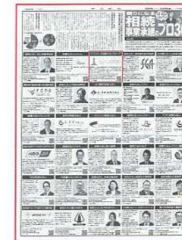
【朝日新聞】 9月29日(金)22面 「頼りになる相続・事業承継のプロ30選」にランドマーク税理士法人が掲載されています。