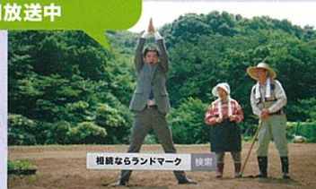
相続ならランドマーク 検索