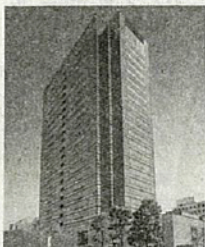
⑨ 武蔵小杉駅前事務所