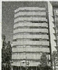
⑧ 新横浜駅前事務所