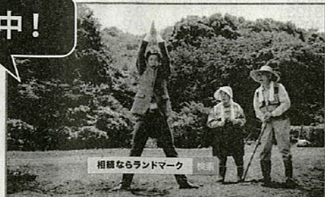
相続ならランドマーク