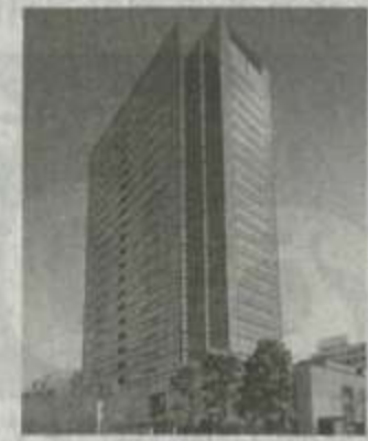
⑬ 武蔵小杉駅前事務所