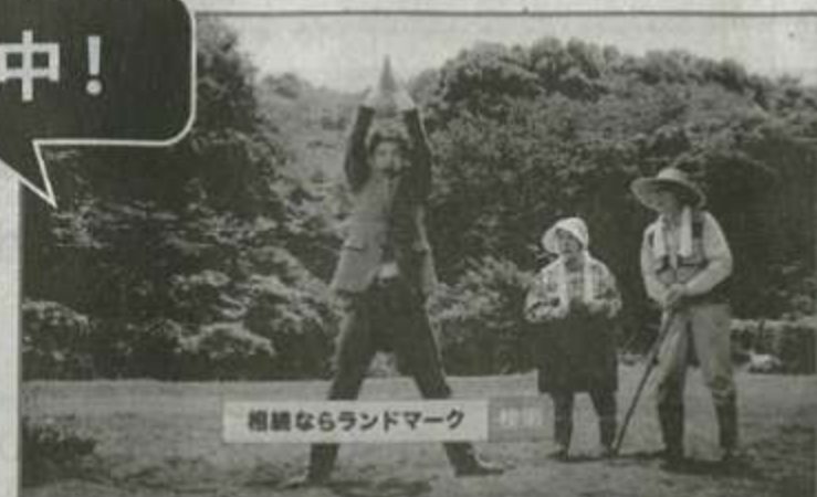
相続ならランドマーク