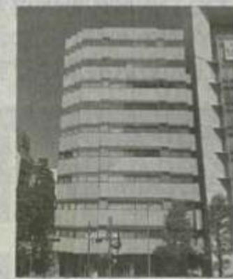
⑨ 新横浜駅前事務所