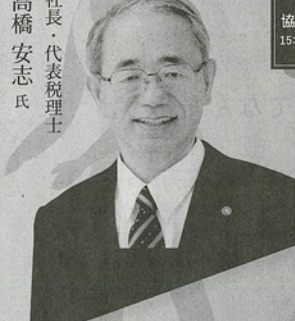
税理士法人安心資産税会計