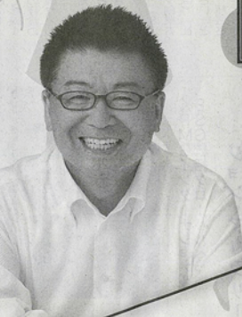
フリーアナウンサー 生島 ヒロシ 氏