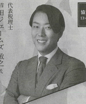
税理士法人ネイチャー