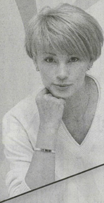
モデル・タレント 梅宮 アンナ 氏