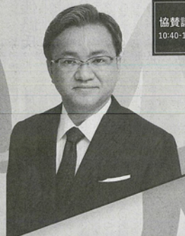
ランドマーク税理士法人