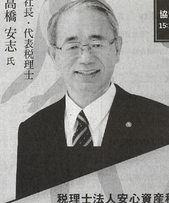
税理士法人安心資産税会計