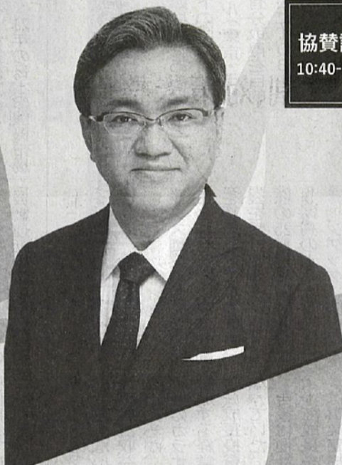
ランドマーク税理士法人