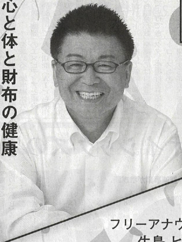
フリーアナウンサー 生島 ヒロシ 氏