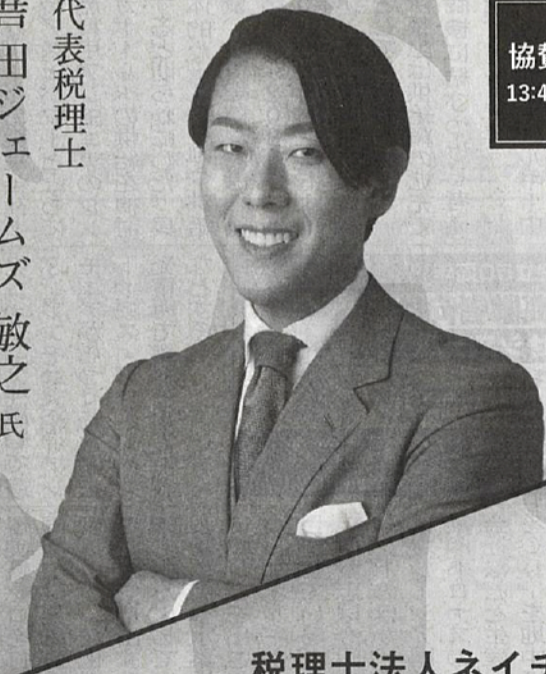
税理士法人ネイチャー