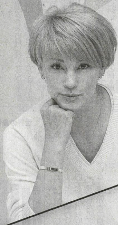
モデル・タレント 梅宮 アンナ 氏