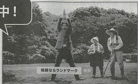
相続ならランドマーク