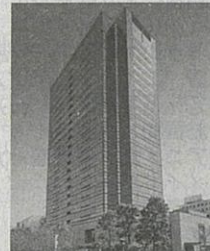
⑨ 武蔵小杉駅前事務所