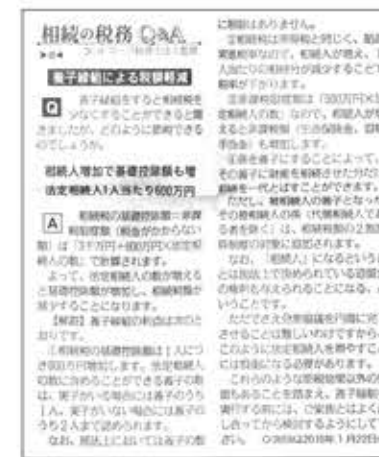
【全国農業新聞】 8面「相続の税務Q&A」 2015年12月18日