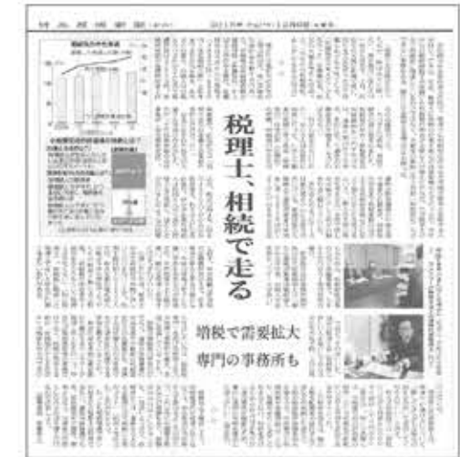
【日本経済新聞】 夕刊9面「税理士、相続で走る」 2015年12月9日