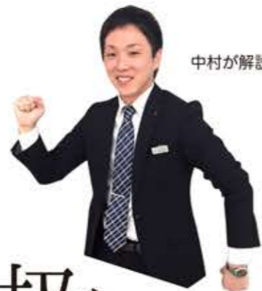
中村が解説します!