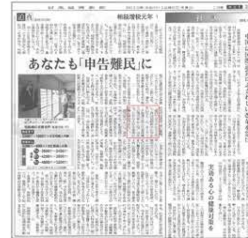
【日本経済新聞】 朝刊2面「迫真」 2015年12月2日