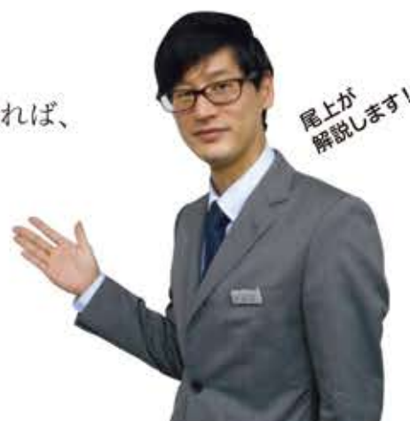
尾上が解説します!

不動産賃貸業を営んでいる方は、多くの事業用財産を抱え、日常的にその修繕・追加購入を行います。これらに係わる出費は、必要経費として全額計上するものもあれば、資産として計上して減価償却の対象とするものもあります。今回は、混乱が多いこの両者の切り分け方についてご説明していきます。