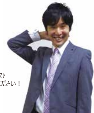
皆さま、ぜひお役立てください！

満期共済金を受け取った場合と同じ考え方で処理します。具体的には、その建更の解約返戻金相当額から資産計上している共済掛金積立相当額を控除した金額がその年の所得(損失)として取り扱われます。