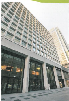
東京丸の内、横浜ランドマークタワーで定期的にセミナーを開催。その他、横浜、川崎の拠点を含めた計5カ所の本支店で無料相談を実施している

ダイヤモンド MOOK 編集 03-5778-7213 販売 03-5778-7240 定価 880円