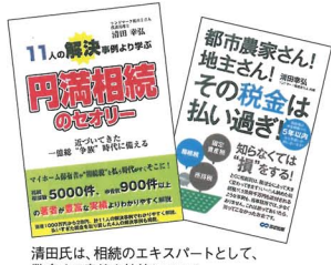
清田氏は、相続のエキスパートとして、数多くの書籍を執筆している

※3 相続税申告書(平均1万円程度) ※4 生前対策を執行する場合の報酬 ※5 ランドマーク税理士法人の各事務所以外の場所で面談を行う際の日当、交通費