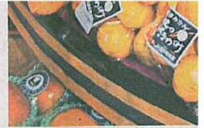
「クイーンズ伊勢丹」の け(東京都墨田区のク